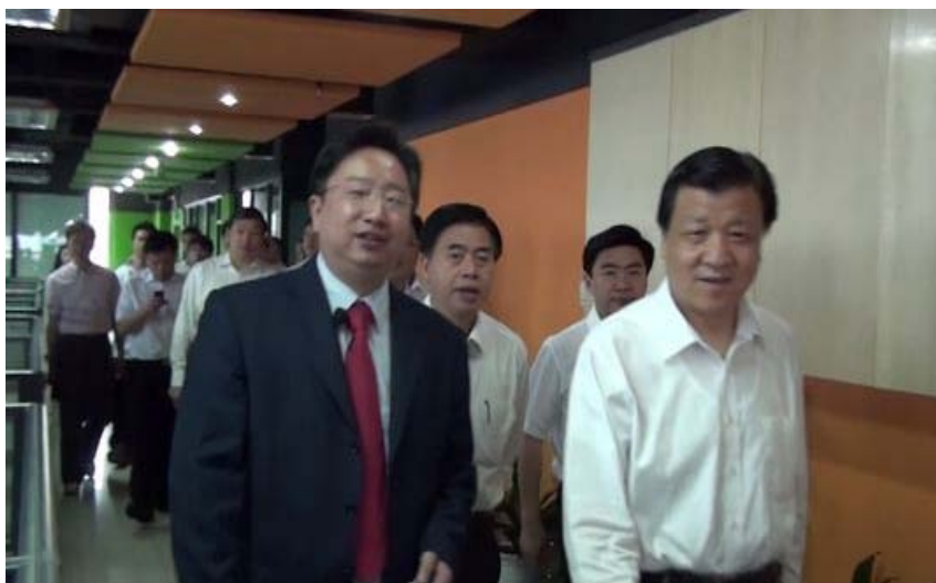
2010年5月13日下午，中央政治局委员、中央书记处书记、中央宣传部部长刘云山视察迅雷。