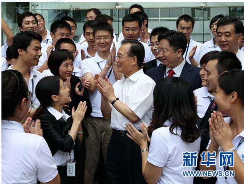
8月20日，温家宝总理参观迅雷网络技术有限公司后，与青年科研人员亲切交谈。